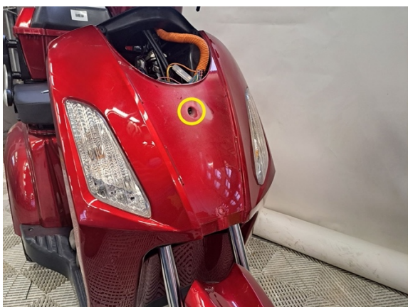
Irrota etukatteen kiinnityspultti. (hylsy 8 mm).