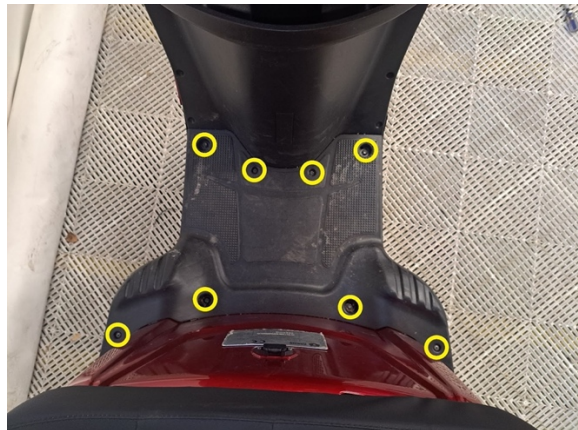
Irrota jalkatilan pohjakatteen kiinnitysruuvit (ristipäämeisseli ph2) ja kiinnityspultit. (hylsy 8 mm).