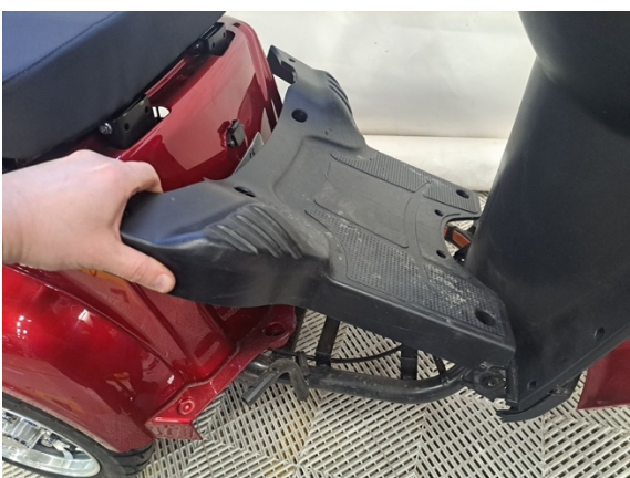
Ota jalkatilan pohjakate pois.