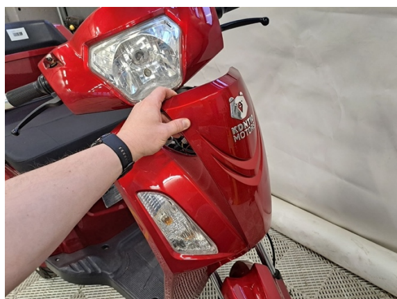
Ota etupaneeli pois.