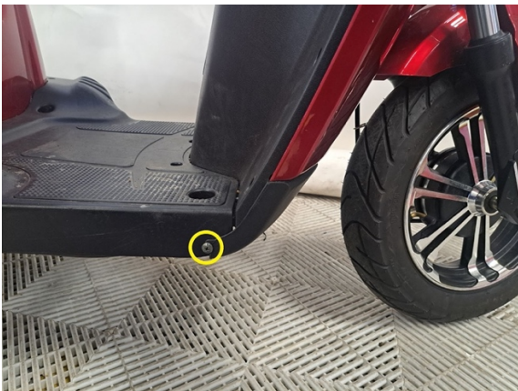
Irrota jalkatilan pohjakatteen kiinnitysruuvit (ristipäämeisseli ph2) kummaltakin puolelta.