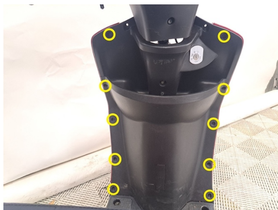
Irrota etukatteen kiinnitysruuvit. (ristipäämeisseli ph2).