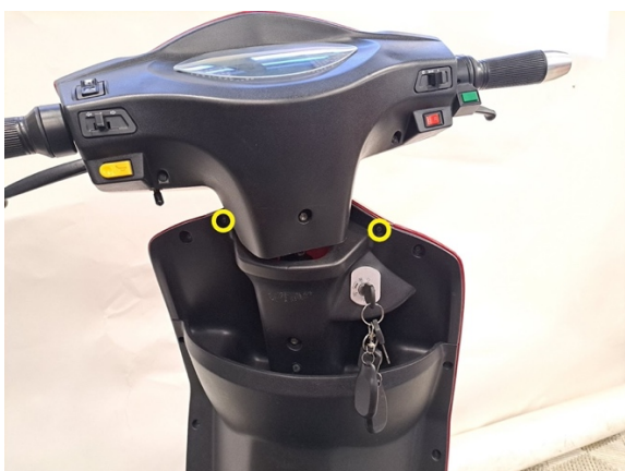
Irrota etupaneelin kiinnitysruuvit. (ristipäämeisseli ph2).