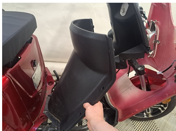
Ota etukatteen alempi sisäosa pois.

Uuden osan asennus käänteisessä järjestyksessä.